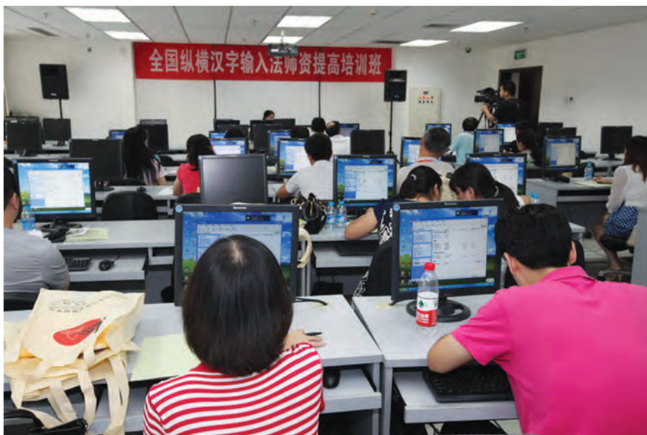
2013年8月8日，全国纵横汉字输入法师资提高培训班现场。