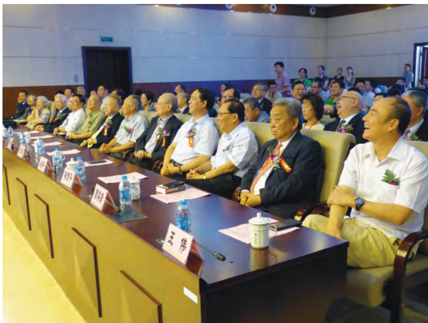
2014年8月15日，出席2014年CKC杯全国纵横汉字输入大奖赛暨纵横码学术研讨会领导、香港苏浙沪同乡会访问团成员和香港嘉宾。