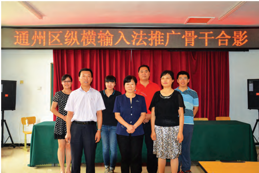
通州区纵横码推介培训工作团队。