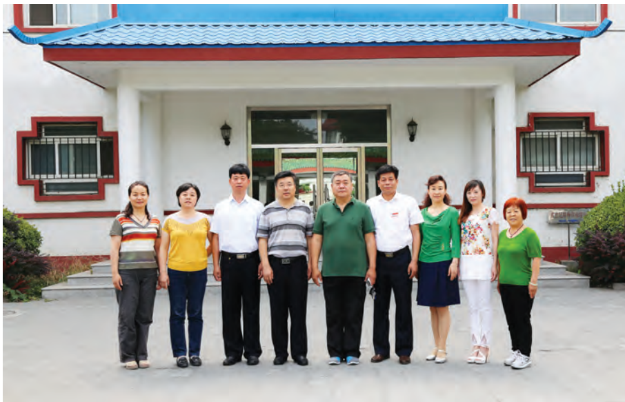
怀柔区纵横码推介培训工作团队。