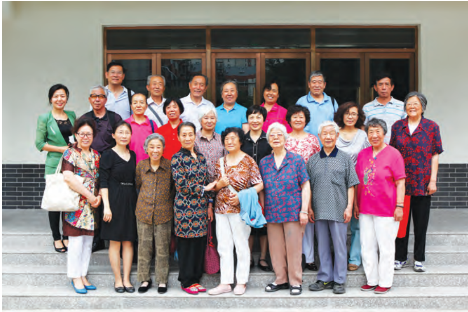
海淀区纵横码推介培训工作团队与部分学员。