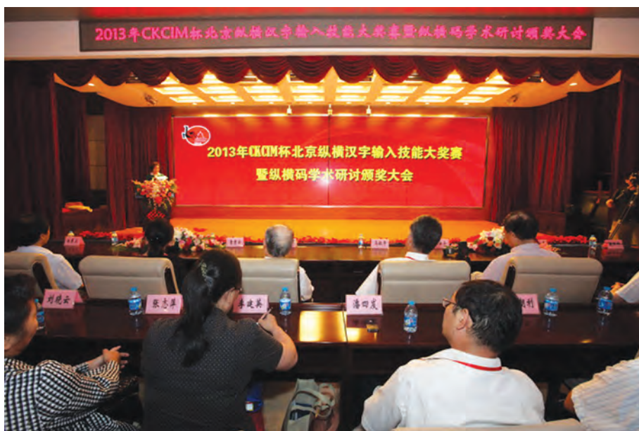
2013年8月8日，2013年CKCIM杯北京纵横汉字输入技能大奖赛暨纵横码学术研讨颁奖大会现场。