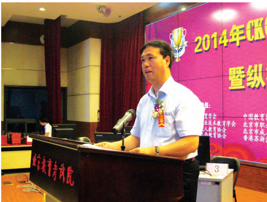
2014年8月15日，北京市教委主任线联平先生在北京举办的2014年CKC杯全国纵横汉字输入大奖赛暨纵横码学术研讨会开幕式上致辞。