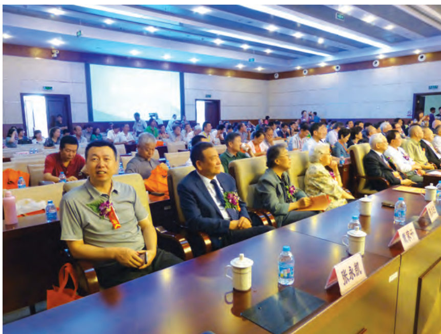
2014年8月15日，出席2014年CKC杯全国纵横汉字输入大奖赛暨纵横码学术研讨会的北京市教委张永凯委员(左一)、中国教育学会戴家干常务副会长(左二)等领导及香港苏浙沪同乡会访问团成员。