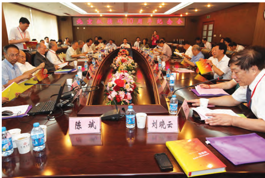
2013年8月8日，北京纵横码10周年纪念会现场。