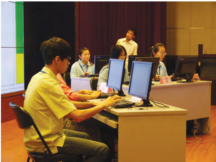
2014年8月15日，2014年CKC杯全国纵横汉字输入大奖赛冠、亚军比赛现场。