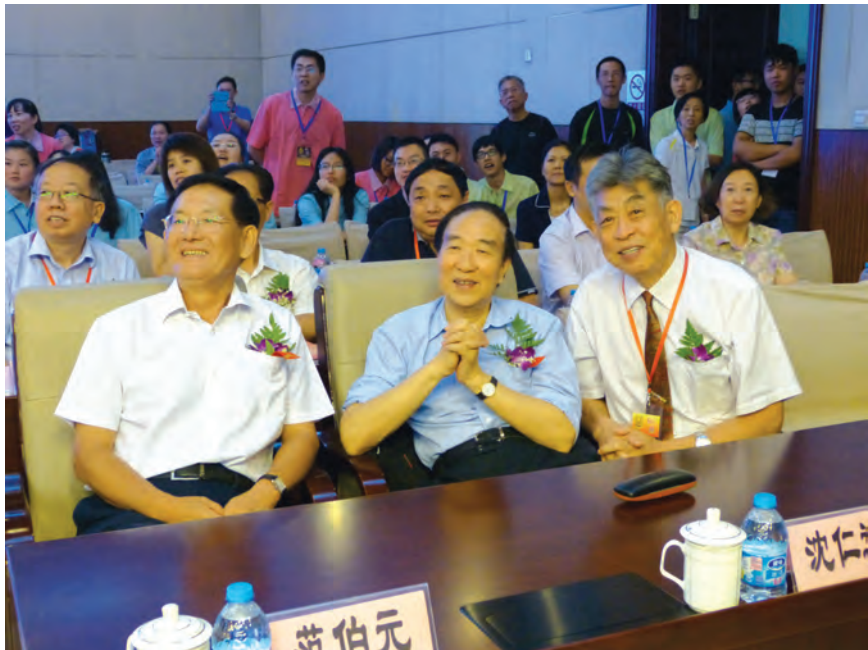
2014年8月15日，出席2014年CKC杯全国纵横汉字输入大奖赛暨纵横码学术研讨会领导。