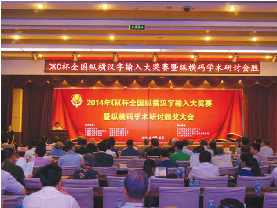
2014年8月15日，2014年CKC杯全国纵横汉字输入大奖赛暨纵横码学术研讨颁奖大会现场。