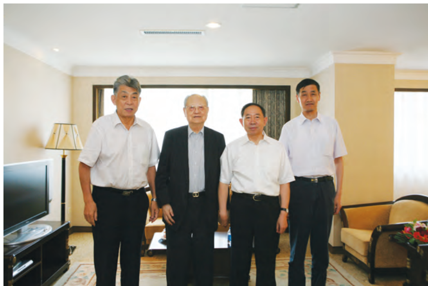
2014年8月16日，教育部部长袁贵仁先生(左三)与周忠继先生(左二)、马叔平先生(左一)、钱培德先生(左四)合影。