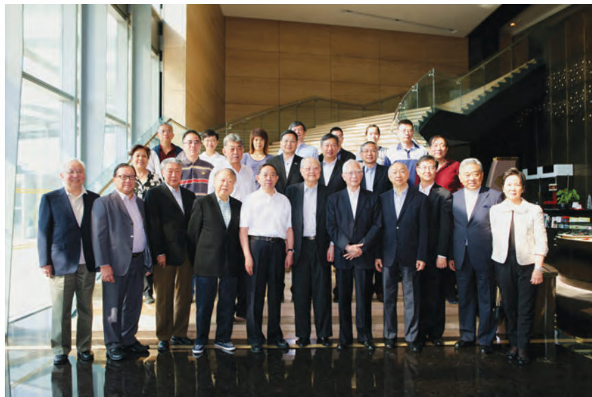
2014年8月16日，教育部部长袁贵仁先生(左五)与周忠继先生(左六)及出席2014年CKC杯全国纵横汉字输入大奖赛暨纵横码学术研讨会香港苏浙沪同乡会访问团和香港嘉宾合影。