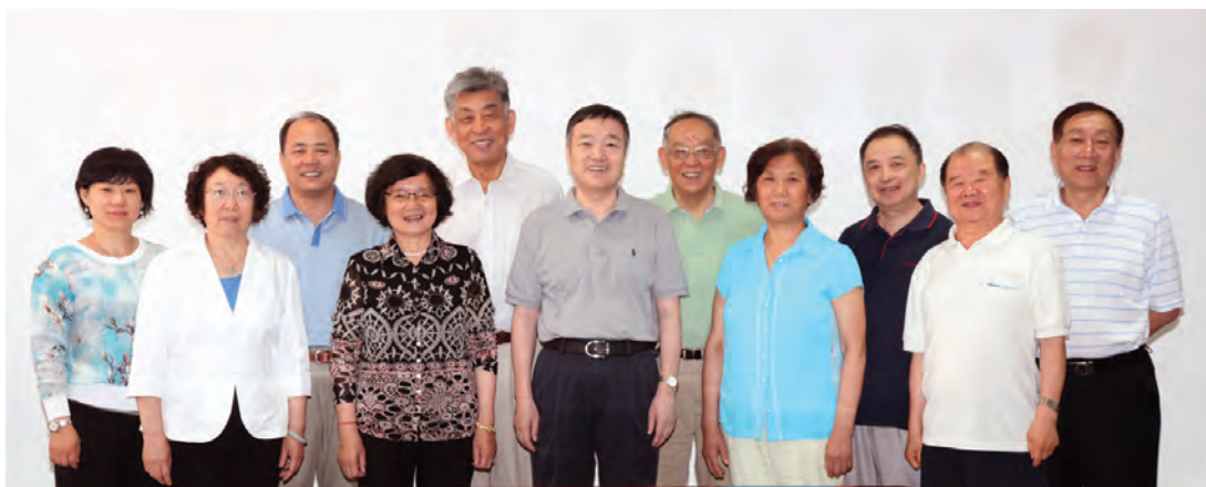
北京市纵横码推介培训工作团队。