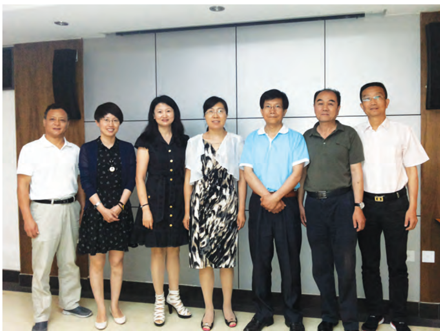
西城区纵横码推介培训工作团队。