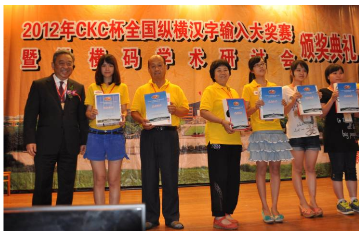
图8 西城区荣获全国大赛一等奖的选手在颁奖典礼上领奖（中）