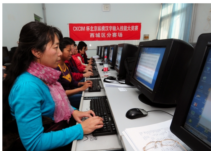
图7 北京纵横汉字输入技能大奖赛西城区分赛场现场

在举办两届纵横汉字输入技能比赛的基础上，西城区经过选拔、集训，两次分别选派37名和32名选手，参加了2011年和2013年“CKCIM杯北京纵横汉字输入技能大奖赛”，取得了显著成绩。北京宣武红旗业余大学大力支持北京市纵横码推介中心，同时也承担了两届“CKCIM杯北京纵横汉字输入技能大奖赛”分赛场的工作，配备了相关人员和技​​术支持，确保了比赛顺利进行（图7）。