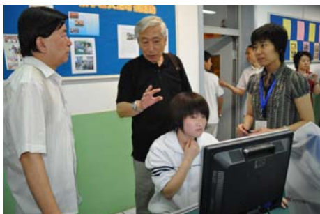
图3 市区有关领导指导西城区裕中中学纵横码培训工作

金融街社区教育学校提供了良好的培训条件，做到一人一机，由计算机老师专门授课并承担辅导参赛选手的任务，先后举办两期培训班，参加培训的居民共40人。同时，辅导的参赛选手中有四名获全国奖项。此外，德胜社区教育学校在培训中共有23名学员参加，其他单位也相继开展了纵横汉字输入技能的培训与宣传，全区参加培训的居民和学生千余人。