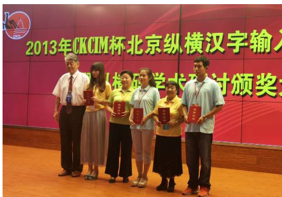
图 10 西城区论文获奖教师在北京市纵横码学术研讨会上领奖（右一）

“汉字纵横，面向世界”，这是全国 26 个省市文化馆馆长代表团一行 90 人，在金融街社区教育学校参观交流时，对计算机班练习的纵横汉字输入法的赞誉。今后，西城区将不断创新教学方法，开拓推广渠道，普及纵横汉字输入技能，全面提升推广工作新水平，让更多的市民享受数字生活。