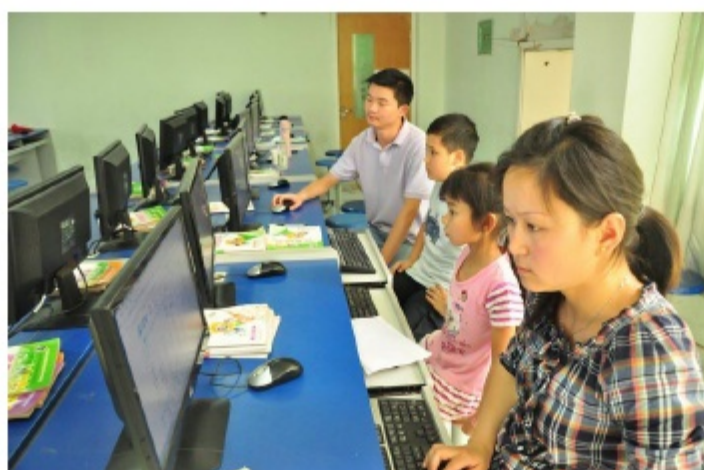
因为网络问题，无法上传答卷，课题组老师以截图方式报大赛组委会。