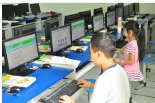
2012全国纵横信息数字化创新学习比赛，参赛选手认真紧张的完成网上试题