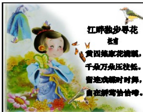
课件《江畔独步寻花》