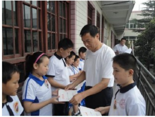
校长亲自为获奖选手颁奖