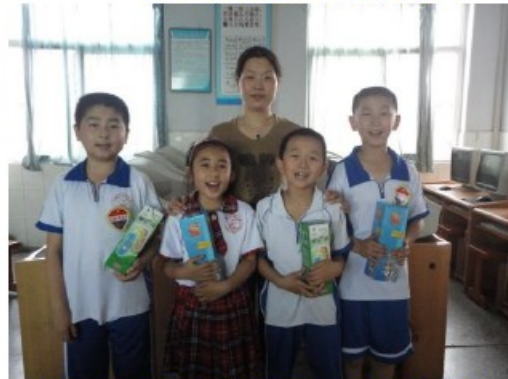
学校领导为获奖选手颁发奖品并合影