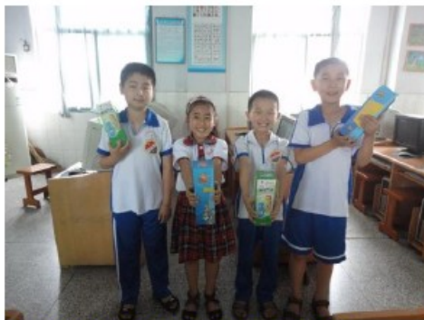
纵横选手拿到奖品后的无限开心