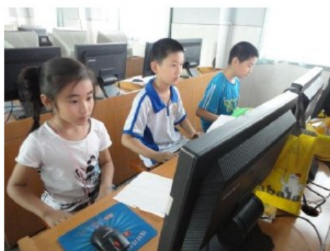
比赛前的紧张练习