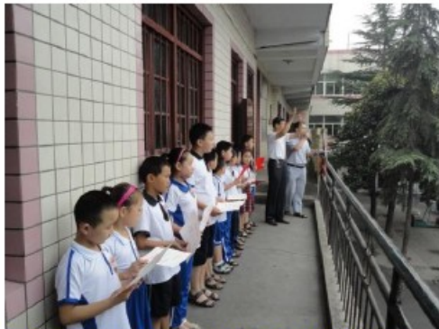
升旗仪式上师生一起为获奖选手鼓掌