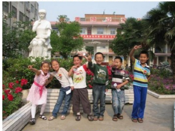
实验学生：学纵横码太快乐了！