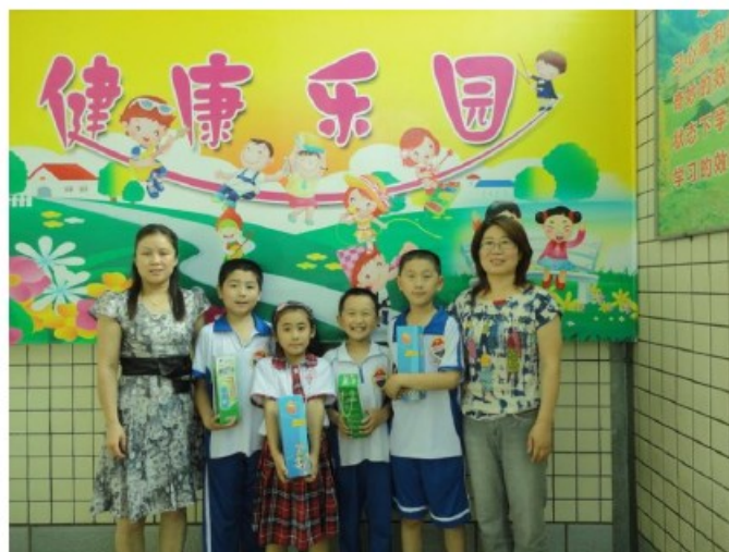
辅导老师和实验学生亲密合影