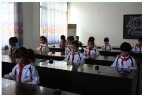
我校实验班的学生在玩“词语游戏”。

通过上一年的培训学习，我校老师以及实验班的学生对纵横码已经有了一个深入的了解。纵横码打字水平已有较大提高，大部分学生能进行自如的三打，所以本年度，我们要做的是在原有的基础上整合纵横技能与语文基础培训，让学生进一步提高三打技能，快速的完成在线博客。