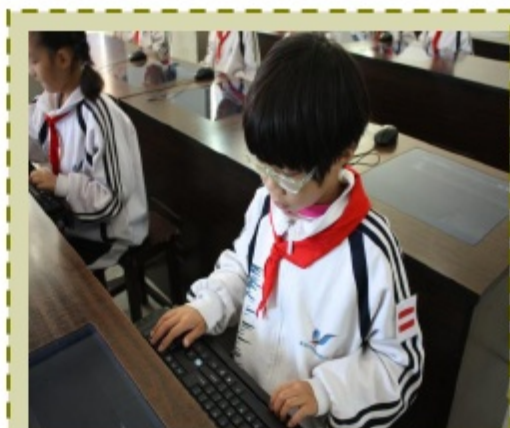
实验班的学生在“三打技能测试中”。