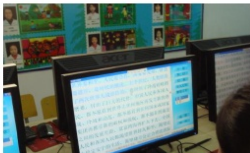
图为纵横兴趣班实验学生正在津津有味地进行文章练打训练。上图为纵横兴趣实验班学生进行文章录入竞赛