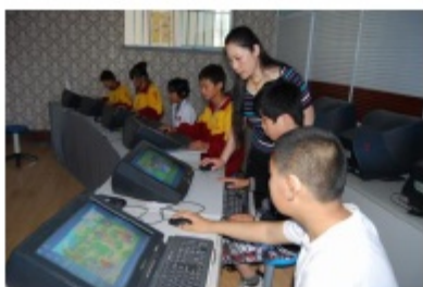
照片 3：实验教师指导学生上机操作