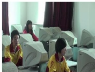
照片 12：我校学生参加 5 月 8 日的