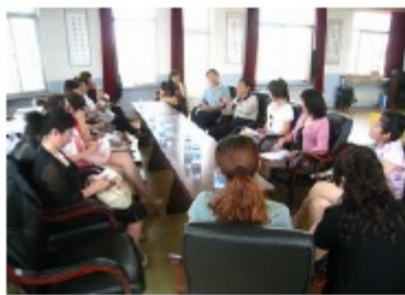
照片 11：本地区课题组成员巡回听 在线