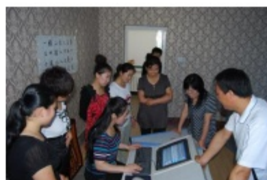
照片 2：对全体实验教师进行纵横码的再次培训