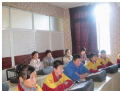
照片 4：实验教师在计算机室听示范课