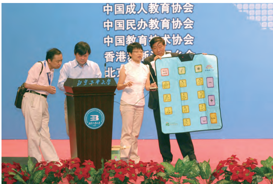
2010年8月8日，在北京举办的全国纵横汉字输入大奖赛上香港嘉宾为大会表演纵横码游戏。