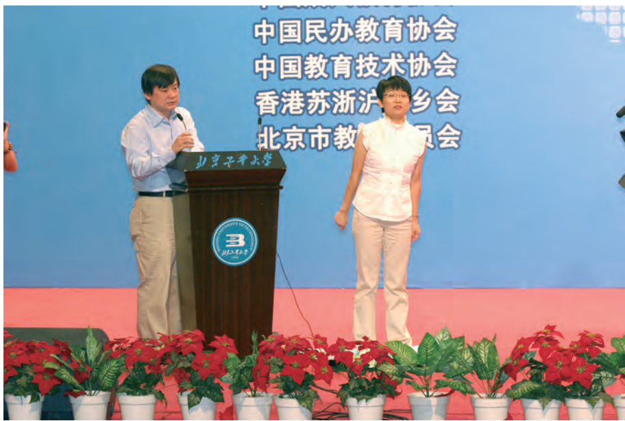
2010年8月8日，在北京举办的全国纵横汉字输入大奖赛上香港嘉宾为大会表演纵横码游戏。