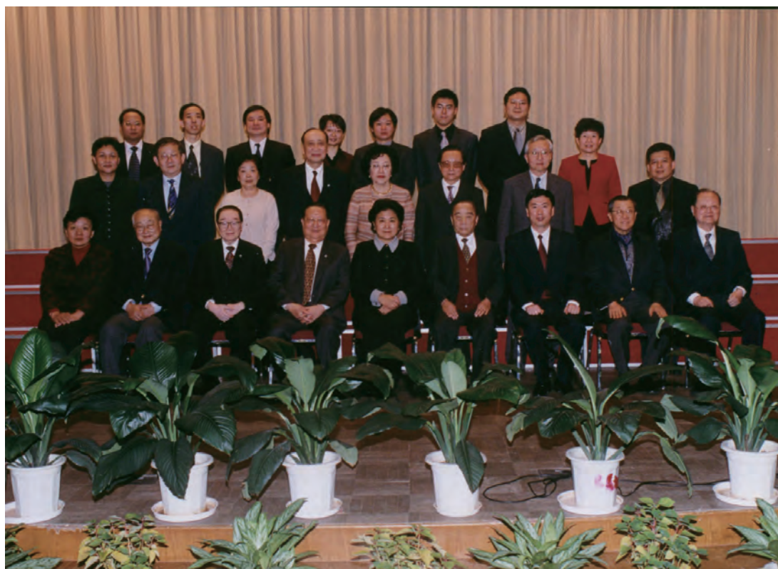
2003年10月17日，时任中央统战部部长的刘延东同志接见周忠继先生一行，与来京参加北京老教育工作者总会纵横汉字信息技术应用研究会成立典礼暨揭牌仪式的嘉宾合影。